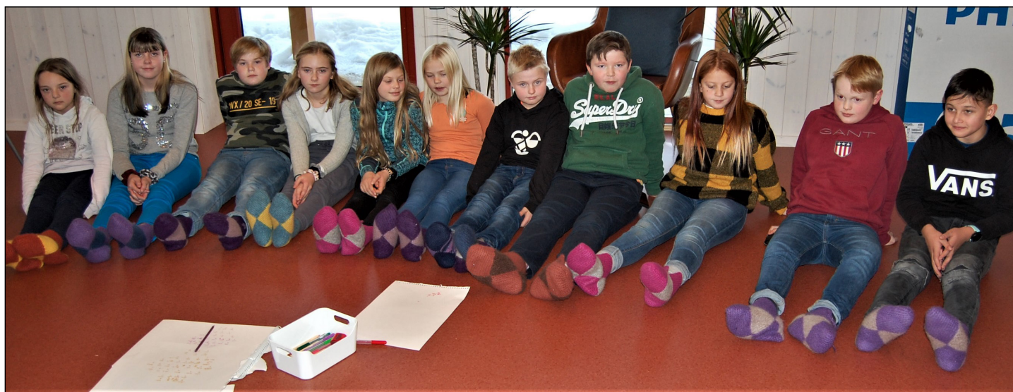
Medlemmene i Midtre Snertingdal sanitetsforening har strikket sokker som barna kan bruke når de er på Kjenset