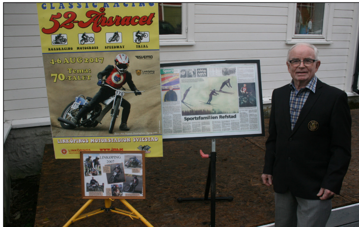
Hovedpersonen i «Utafor ramma» med noen oppslag fra eget liv