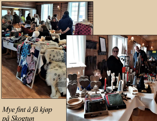
Mye fint å få kjøp på Skogtun