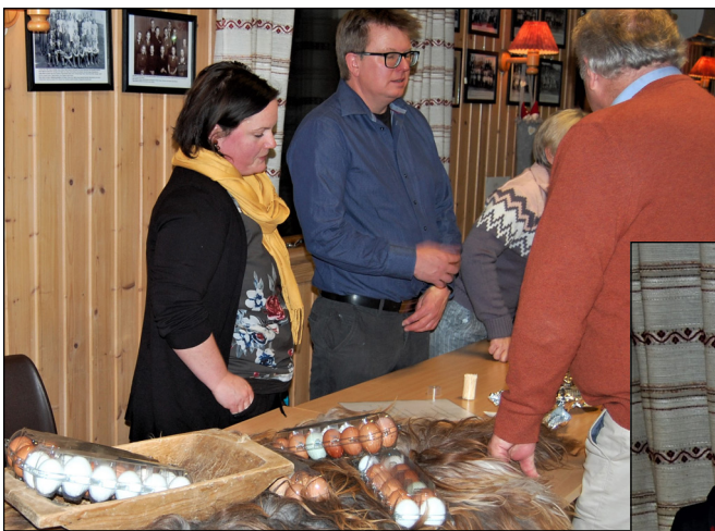
Mat fra Snertingdal representert av folka i Ekeren, midtre